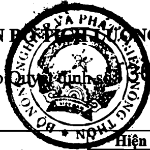
Biểu số 1

(kèm theo Quyết định số 367/QĐ-BNN-KH ngày 22 tháng 6 năm 2011)